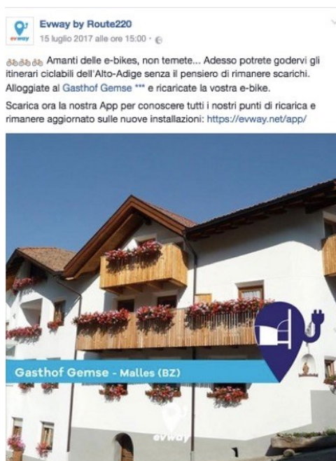
Esempio di post promozionale sulla pagina Facebook di evway di un hotel con stazione di ricarica eBikes